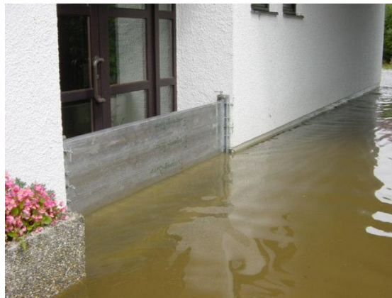
Mobile Wand / barrière mobile

Ce document est inspiré de celui réalisé par la commune de Mersch