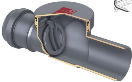
Rückschlagklappe / clapet anti-retour

Überschwemmungsgebiet (HQ100) nahe Reichlange / Zone inondable (HQ100) au niveau de Reichlange